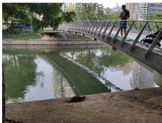
図1.カワウソを観察する住民の様子

そして特筆すべきはこれらのカワウソが非常に人に慣れている点で、今回も日曜日の朝ということもあり周りには非常に多くの住民が行き来して騒がしい状態であったが、カワウソは全く気にすることなく遊泳や捕食を行っていた(図3,4)。