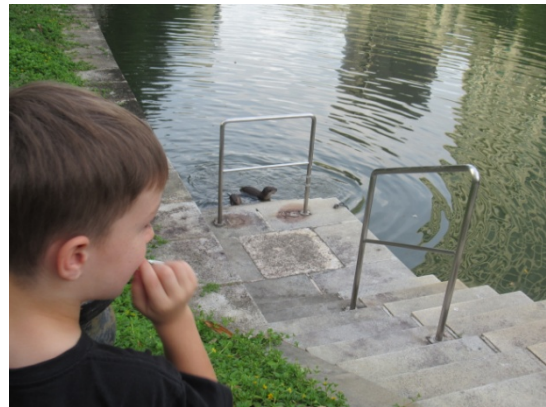
図3. 通行人が近くで見ているにも全く気にする様子のないカワウソ

このように非常に発達した都会において人間とカワウソの理想的な共存関係を確立しているようにも思えるシンガポールであるが、ここ最近では個体数がかなり増加し飽和状態に近づいているとの見方もある。そしてカワウソが道端にする糞便が非常に臭いとの苦情もあり、全ての住民がカワウソに理解を示しているわけではないようだ。このようにシンガポールにおいてもいくつかの課題があることが浮き彫りとなったが、世界的に都市化が避けられない状況において人とカワウソの共存の道しるべを示す場所に違いないと感じた。