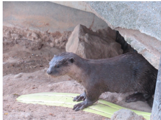
図4. 生後約4ヶ月の幼獣